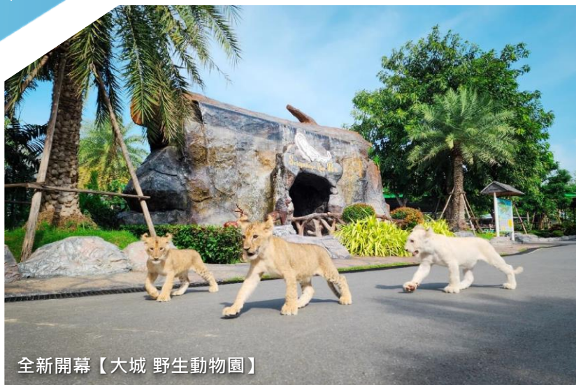
全新開幕【大城 野生動物園】

佛統府 (Don Wai 傳統 水上市場) 全新開幕【大城 野生動物園】 大城遺址 (崖差蒙空寺、瑪哈泰寺) 人氣之首 (吞武里海鮮市場) 熱帶雨林小河流Café (包飲品一杯) Pa Boon Café (包指定飲品一杯) 爽泰文化村莊 (體驗潑水節及水燈節 + 騎大象 + 坐馬車) 泰式料理 烹飪體驗 必逛 Jodd Fairs 喬德夜市