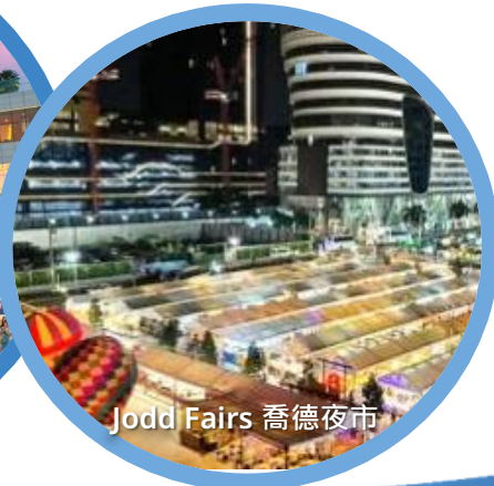
Jodd Fairs 喬德夜市